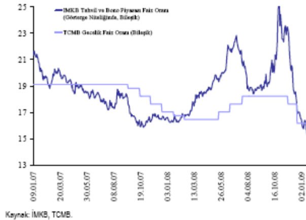
Grafik 1.1.1 TCMB Politika Faizi ve Gösterge Tahvilin Faizi (Yüzde)

Tüm bu gelişmelerin sonucunda gösterge niteliğindeki Devlet İç Borçlanma Senedi(DİBS) faiz oranları %12,1'e kadar gevşemesi ile TCMB gecelik faiz oranı arasındaki fark kapanmıştır. (Grafik 1.1.1).